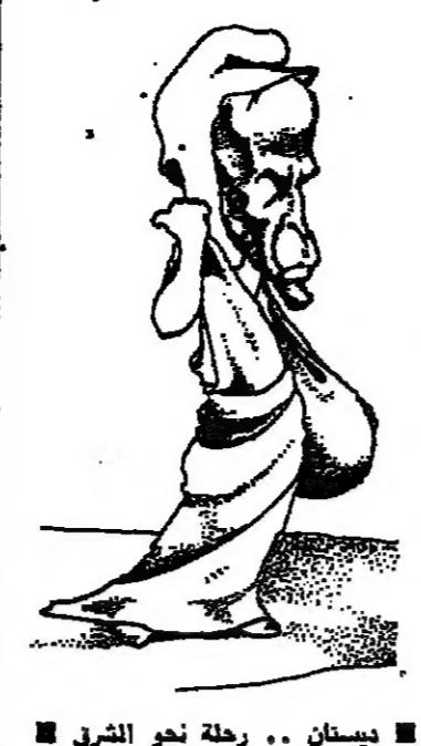
ديستان .. رحلة نحو الشرق

عندما كان كل من يمارس تلك التحالف يومه بالفاشيستية او اليهودية .